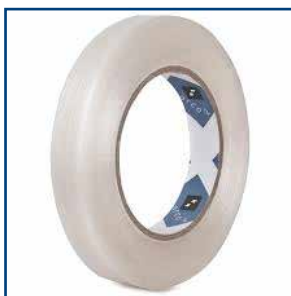
Nastro alta temperatura per fissaggio termocoppie