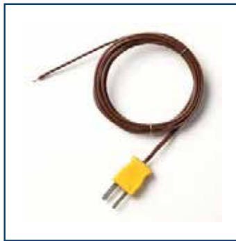
Termocoppia con connettore