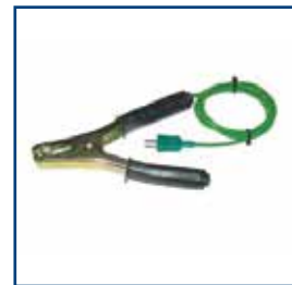
Termocoppia a pinza