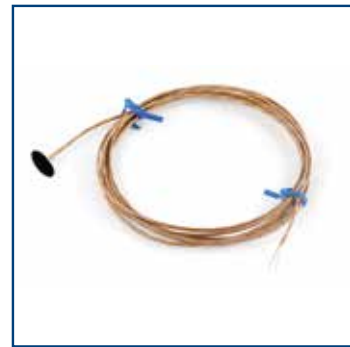
Termocoppia con disco di rame