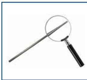
Termocoppia con giunto caldo rastremato